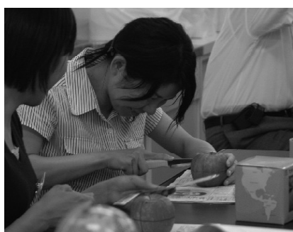
写真13 リングを使った緯度・経度の学習