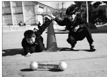
写真2 転がり車による測定