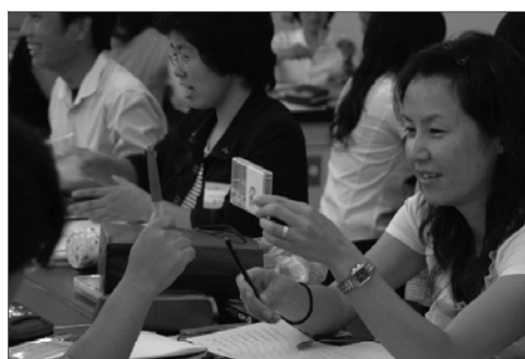
写真6 自作「数の分解」教具での演習