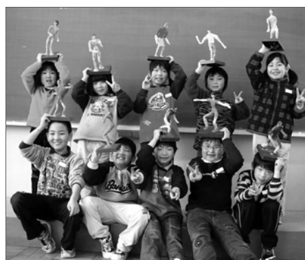
写真 18 1年生の作品