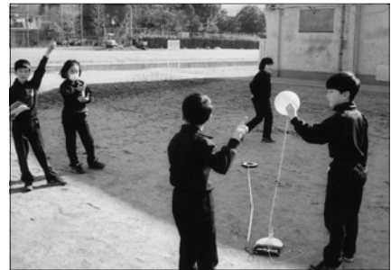
写真3 風船による北風の速さの測定