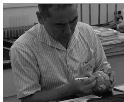
写真14 兵庫県を北極とした地球儀作成