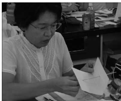
写真9 赤道型日時計作り