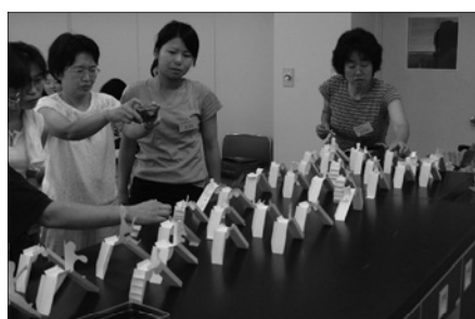
写真7 二面角を生かした滑り台