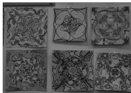
写真8 先生方の90度回転模様の作品