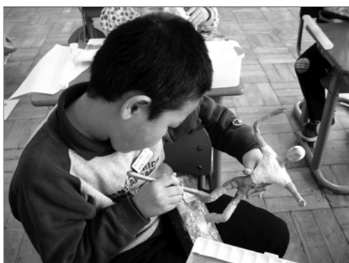
写真 17 研修内容を教育実践する