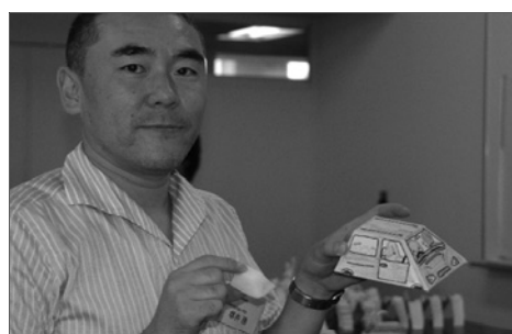
写真12 ジャガイモ車と自作張りぼて車