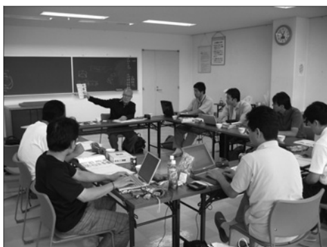
写真 15 勉強会の様子