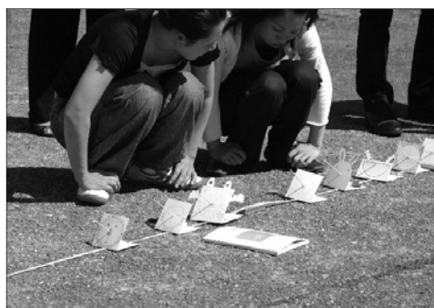
写真10 自作日時計での時刻調べ