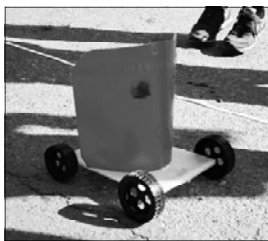
写真1 帆かけ車による測定

この様な内容を講義することで、つまずきは確かに存在するが、どうしてつまづくのかを根元まで研究することが、新しい教育内容の開発につながっていくことを理解して欲しいと願っている。