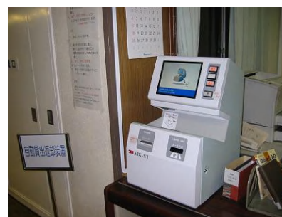
自動貸出返却装置