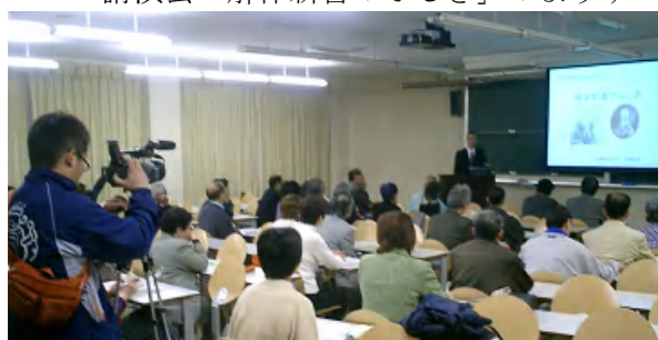
講演会「解体新書のふしぎ」のようす