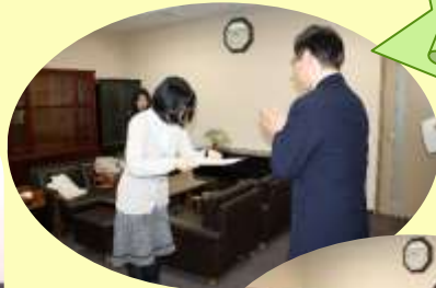
館長から賞状が授与されました