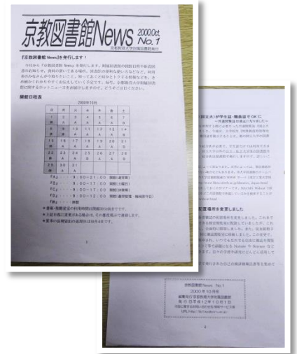
図書館ニュース第1号の写真(館内に実物が配架されています。)

もちろん、図書館からの各種お知らせは今も変わらず掲載しています。これからも図書館のホットなニュースをお届けしてまいりますので、是非ご愛読ください！