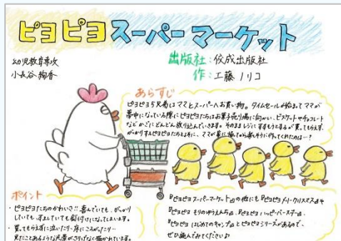
『ピヨピヨ スーパーマーケット』作：工藤 ノリコ 出版社：佼成出版社