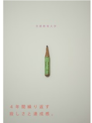
⑩『vandalism 2』 村田遼平